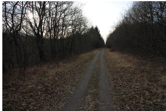
Bild 2: Blick auf die Gras-Schotterstrecke mit Fahrtrichtung Dransfeld.